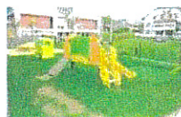
Graines de Marmots