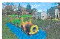
Le Relais du Haut