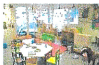
Les Petits Ecureuils