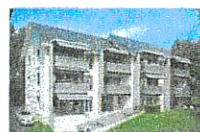
Le Relais du Bas